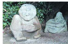
←猿石…吉備姫皇女王墓内にある奇石で、全部で4体ある。ユニークな人面石像であるが、猿ではなく渡来人を象ったものであるといわれている。