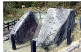
←鬼の雪隠…古墳の石室の蓋石。雪隠 (せっちん) はトイレという意味です。

亀石…亀の形の遺構。長さ3.6m、幅2.1m、高さ1.8mの巨大な花崗岩に亀に似た彫刻が彫られているのでこの名前と呼ばれている。目的はわかっていない。→